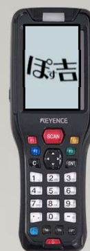
入荷や棚卸、その他作業用 ハンディターミナル